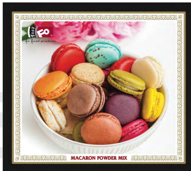
MACARON POWDER MIX